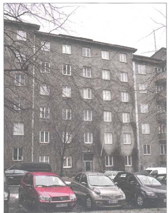
Kivelänkatu 1 b sijaitsee Mannerheimintien lähisyydessä, Hotelli Crowne Plazaan vastapäätä.