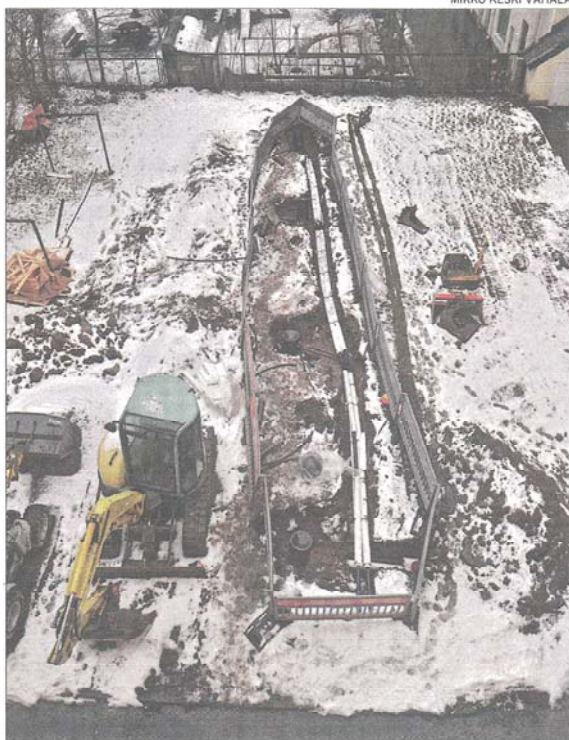
Taloyhtiön tontille porattiin yhteensä neljä 220 metrin syvyistä reikää. Maahan porattujen reikien huoltokannet maisekoidaan pilhaan sopiviksi.

Huoltotoimet ovat yksinkertaiset. Yksi suodatin pitää vaihtaa keran vuodessa. Lämpöpumpun kuluvat osat pitää vaihtaa 25 vuoden välein. Ne maksavat nykyisin 2000 euroa, kaukolämpölaitteen uusiminen 20 vuoden välein maksaa 20 000 euroa nykyisin.